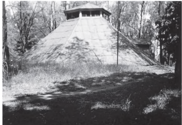
Рис. 4. Дерев'яний павільйон над реконструйованим житлом з Добранічівки у Переяслав-Хмельницькому музеї народної архітектури та побуту (далі — ПХМНП)