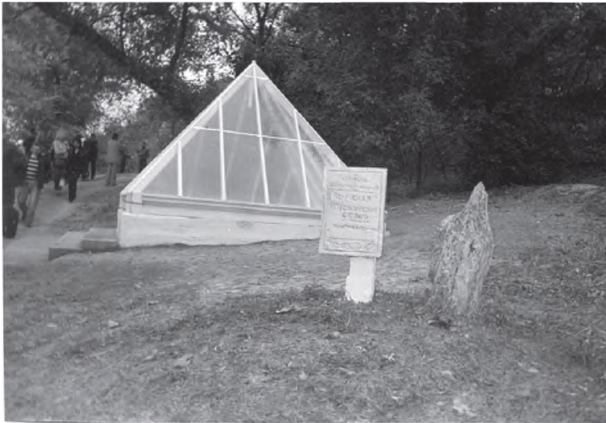
Рис. 1. Павільйон над ділянкою розкопу В.Є. Куриленка 2008 р. на Мізинському пізньопалеолітичному поселенні Чернігівська обл.)