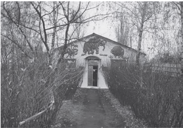
Рис. 2. Загальний вигляд павільйону Археологічного музею «Добранічівська стоянка» (відкритий 1977 р., Київська обл.)