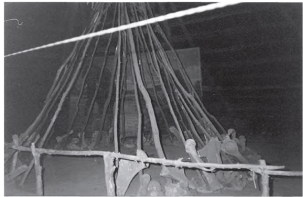
Рис. 5. Реконструкція 1969 р. І.Г. Шовкопляса, М.І. Гладких та М.І. Сікорського житла мешканців Добранічівки. У цьому павільйоні