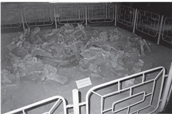
Рис. 3. Рештки четвертого житла з кісток мамонтів у цьому музеї