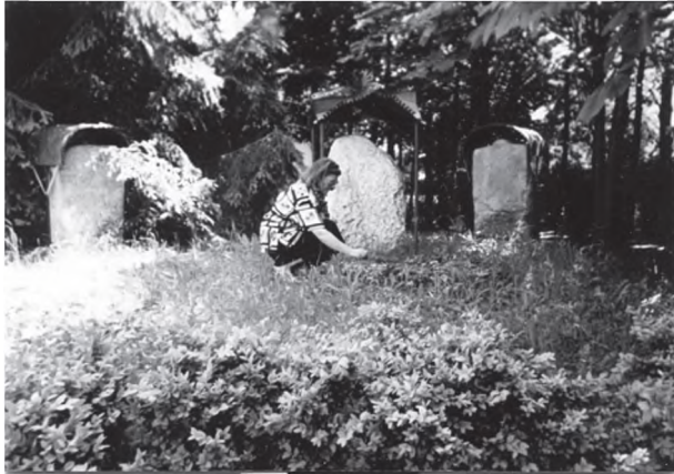
Рис. 7. Реконструкція святилища доби бронзи з с. Степове Миколаївської обл. Розкопки І.М. Шарафутдинові. На передньому плані археолог-музеезнавець Г.М. Бузян. ПХМНП

печити збереження відкритих пам'яток у тому вигляді, у якому вони дійшли до нашого часу або були розкопані археологами, а також схоронність історично пов'язаної з ними території. Останнє зумовлює визначення зон охорони пам'яток археології.