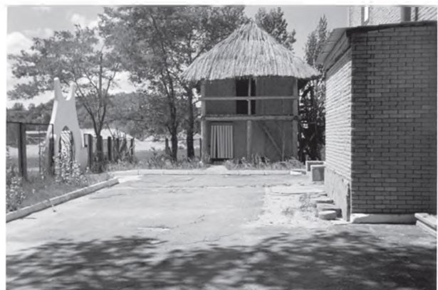
Рис. 6. Реконструкція трипільського житла у с. Трипілля Київської обл. М.Ю. Відейка

Критеріями до експонування відкритих у ході археологічних розкопок об'єктів повинні бути наступні: історико-культурна значущість; ступінь збереженості; характер матеріалу; масштаби археологічних розкопок та ступінь вивчення пам'ятки; доступність для відвідувачів; можливості врахування всіх культурних шарів пам'ятки; можливість довготривалої консервації;