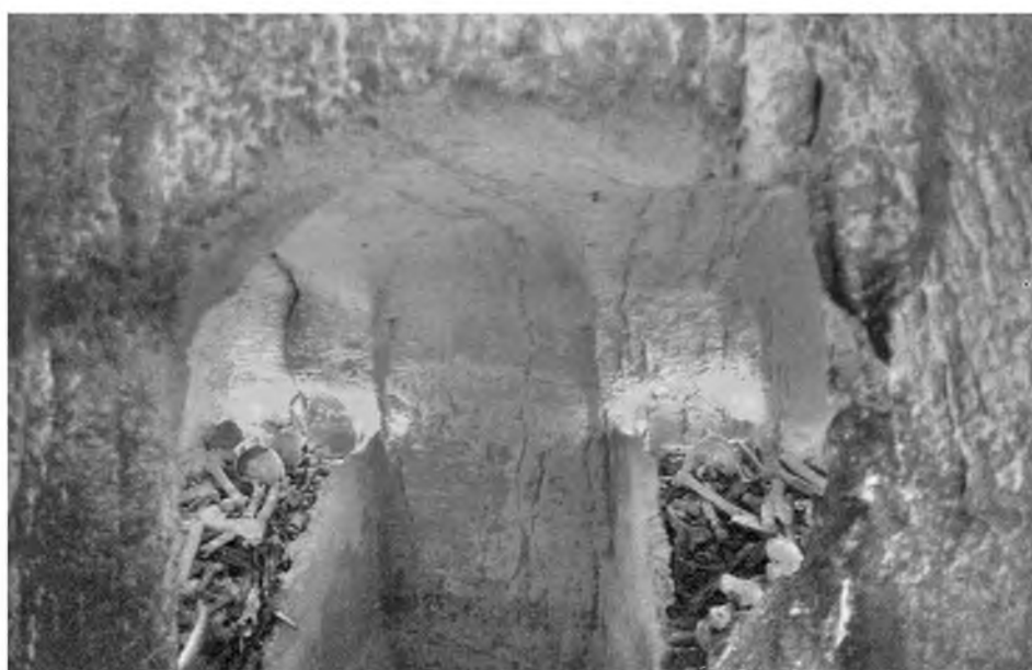
Рис. 3. Поховальні печери в монастирі Св. Онуфрія Великого