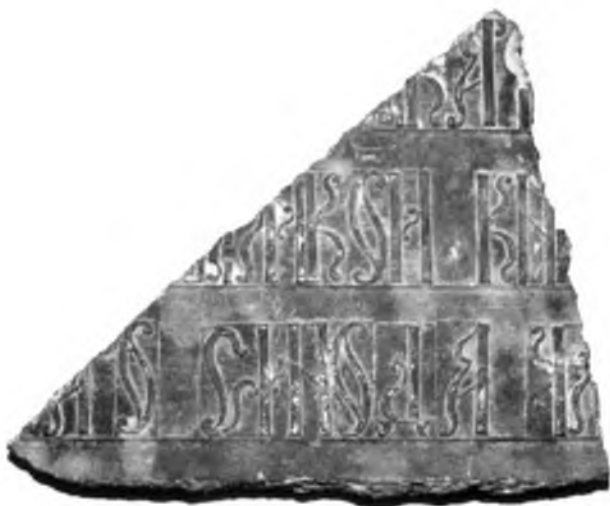
Рис. 1. Фрагмент бронзового дзвону

заввишки 6 см і завширшки 2 см, складаючи відношення ширини літер до висоти 1:3. С. Висоцький вважав, що такий показник в'язі можна застосувати для датування напису. Він також звернув увагу на те, що відстань між рядками напису становить 2 см; а у напису збереглися літери: «А» – двічі, «Д», «И» – тричі, «К» – двічі, «П» – двічі, «0» – тричі, «С» та «І» (пси). Аналізуючи манеру креслень літер, зокрема, викривлення літер «0», «С» та ін., Висоцький висловив думку, що вони характерні для в'язі XVII ст. У той же час, він відмітив, що деякі прикмети свідчили про більш пізній час виконання напису.