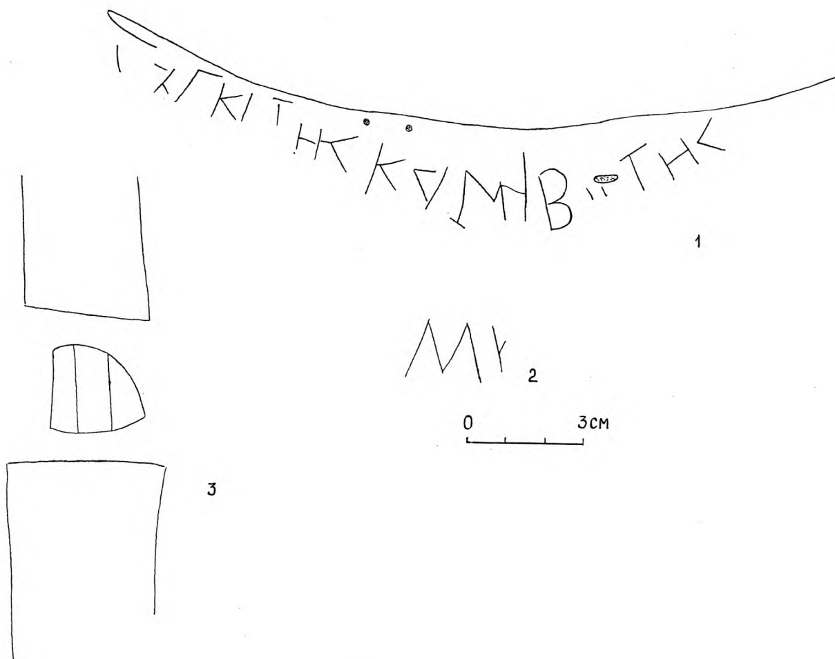
Рис.2, 1-3 - Граффити на амфорах.