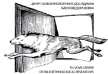
Th. Vovk Center for Paleoethnological Research, Ukraine Центр палеоетнологічних досліджень ім. Хв. Вовка, Україна