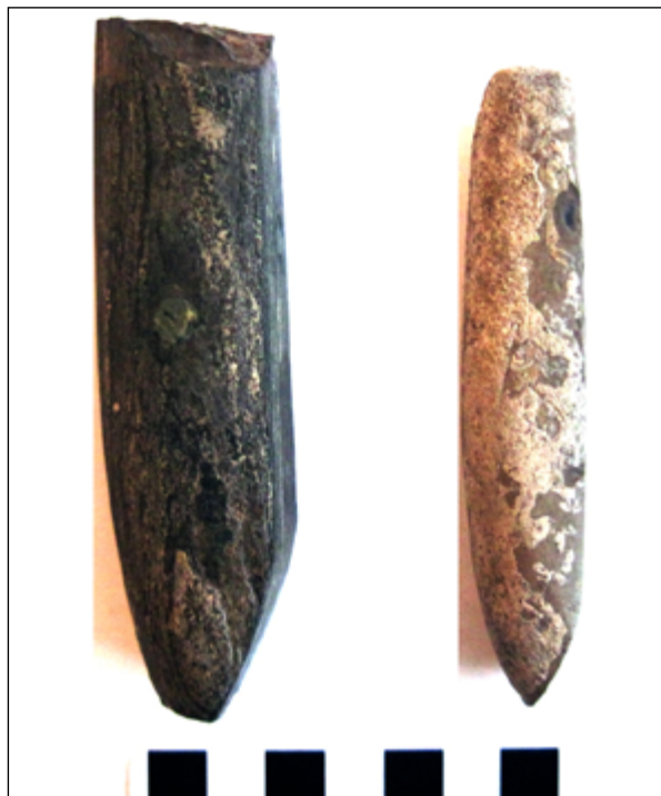
Рис. 1. Сокири-тесла з пам'ятки Кам'яне-Завалля

До найбільш цікавих знахідок на поселенні належать 1 фрагмент та 1 ціла сокира-тесло типу Schuleistenkeil (рис. 1).