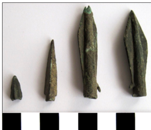
Рис. 8. Завалля, Таужне, Казавчин: наконечники стріл

Вихованцями гуртка на протязі 2000-2018 рр. обстежували такі поселення: Біла Скеля, Завалля-Радсело, Завалля-Чарнокіт, Жакчик-1, Козачий Яр-7 та інші.