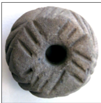
Рис. 9. Прясельце з с. Берестяги

Заслуговує на увагу прясельце, знайдене на території с. Берестяги Гайворонського району, орнаментоване групами з трьох навскісних ліній (рис. 9), а також виявлене на поселенні Козачий Яр-7, виготовлене зі стінки червоно-глиняної амфори.