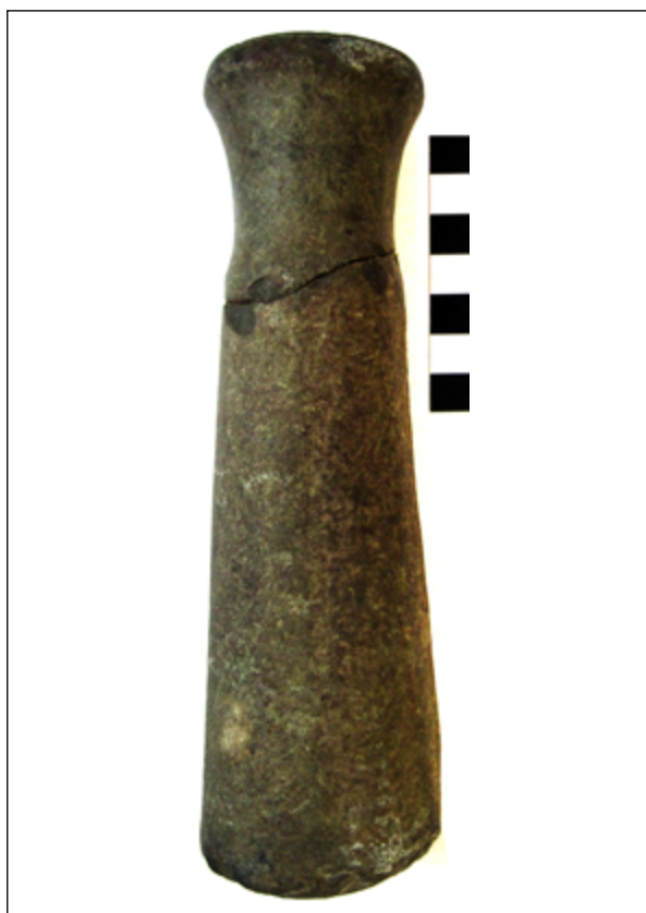
Рис. 7. Розтиральник-«скіпетр» з с. Жакчик

Поблизу Білої Скелі гуртківцями був виявлений бронзовий наконечник стріли з двома лопастями та втульчатим отвором, який має аналогію з наконечниками раннього залізного віку і, можливо, відноситься до кіммерійської або чорноліської культур.