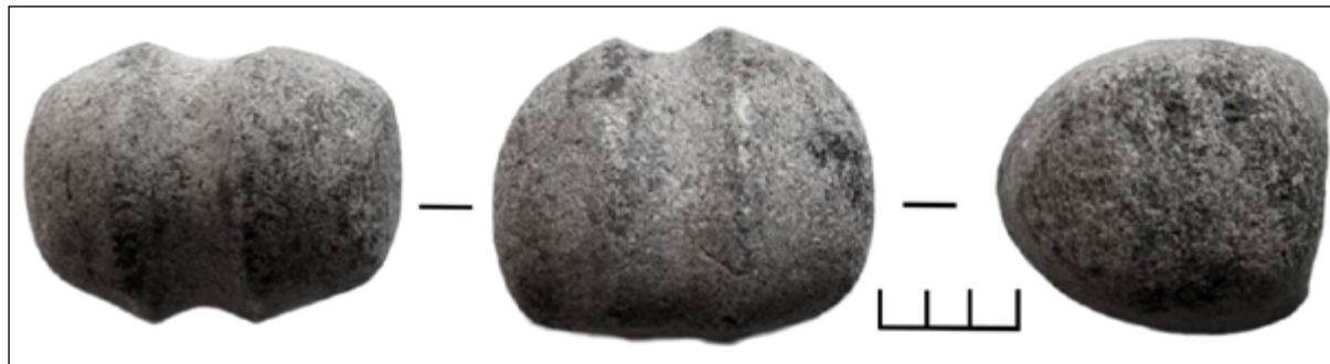
Рис. 6. Козачий Яр-3. Наверх кам'яної булави

які належать сабатинівській та білозерській археологічним культурам. Зокрема, на поселеннях крім фрагментів ліпної кераміки було знайдено наверх кам'яної булави (Козачий Яр-3) (рис. 6), фрагмент бронзового ножа та крем'яний наконечник списа (Березівка-3) (Пересунчак 2018).