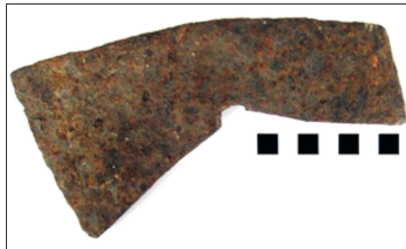
Рис. 10. Кам'яний Брід. Залізна сокира

Таким чином, протягом 2000-2018 років в наслідок роботи гуртка «Юний археолог» на поверхнях пам'яток археології зазначеного регіону, що систематично руйнуються в наслідок господарських робіт, були підняті та передані науковим установам артефакти, що хронологічно охоплюють періоди від пізнього палеоліту до середньовіччя. Дана стаття має за мету привернути увагу відповідних владних структур до проблеми збереження культурної спадщини минулого та залучення науковців до вивчення стародавньої історії Середнього Побужжя.