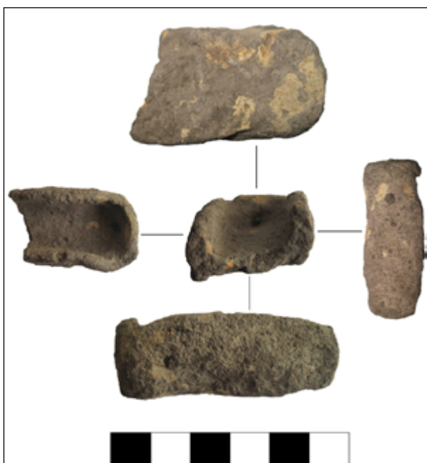
Рис. 2. Ташлик. Фрагмент ливарної форми

ІА НАНУ, Гайворонського районного краєзнавчого музею та публіковався у вітчизняних та закордонних наукових виданнях (Thomas, Posselt, Dębiec, Kiosak, Tkachuk 2016; Petrequin, Errera, Voinea, Tsonev, Turkanu, Serbanescu, Kiosak, Peresunchak, Polischuk, Chernakov 2017). До найбільш цікавих знахідок, які були опубліковані, належить подвійна керамічна статуетка під умовною назвою «Дві богині» з поселення Могильне-3 (рис. 3) (Пересунчак, Бурдо 2015) та фрагмент знаряддя із жадаїту, піднятий на пам'ятці Тополі (Petrequin, Errera, Voinea, Tsonev, Turkanu, Serbanescu, Kiosak, Peresunchak, Polischuk, Chernakov 2017).