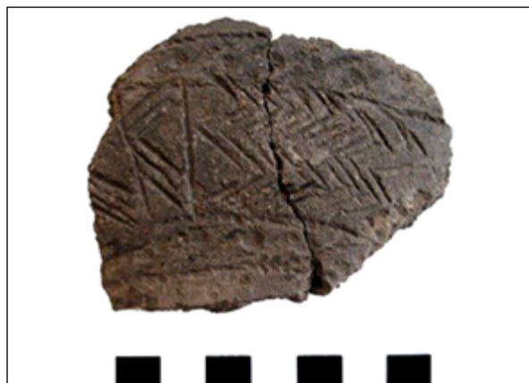
Рис. 4. ▲ Фрагменти кераміки з кургану №13 поблизу урочища Козачий Яр

Так, під час обстеження розкопаного грабіжниками кургану №13 поблизу урочища Козачий Яр, в його насипі виявлені 2 фрагменти чорнолощеної кераміки з прокресленим ялинковидним орнаментом, заповненим білою пастою (рис. 4, 5). За попередніми висновками, дані артефакти належать до чорноліської археологічної культури (Рудь, Пересунчак, Собчук 2018).