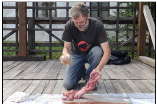
Рис. 8. Проведення етапу «С» – розчленування туші барана гальковим знаряддям

Fig. 7. Discuss the results of the experiment