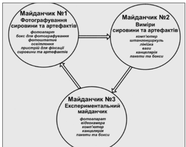
Рис. 2. Спеціалізовані майданчики по обробці з обробки та фіксації матеріалу в процесі експериментальних досліджень Fig. 2. Specialized sites for processing and fixing material in the process of experimental research

Кожному експериментальному предмету присвоюється порядковий ідентифікаційний номер сировини (ID) та шифр експериментальної програми. Наприклад, EMJ19A_1, де «EMJ19A» – експериментальна програма 2019 року кафедри археології та музеєзнавства КНУ імені Тараса Шевченка «Перші техніки та технології ранньої преісторії України» що реалізується на базі експериментальної