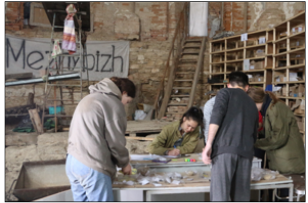
Рис. 6. Процес обробки та фіксації матеріалу на експериментальному майданчику

Fig. 5. Experimental site in one of the rooms of the State Historical and Cultural Reserve «Mezhybizh».