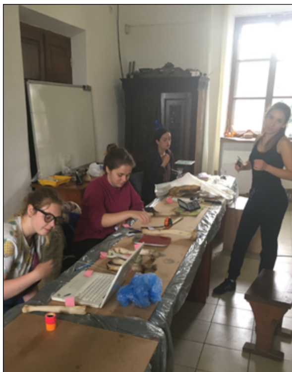
Рис. 4. Лабораторія опису та фіксації експериментальних матеріалів у Державному історико-культурному заповіднику «Межибіж»

Після завершення експерименту всім артефактам присвоюється ідентифікаційний номер експерименту (ID). У цьому разі після номеру ID сировини в загальному шифрі експериментальної програми ставився номер ID експерименту. Наступним після номеру ID експерименту ставилися номери частин сировини (від великих розмірів до малих), що були отримані в процесі експериментальної обробки матеріалу. Наприклад: EMJ19A_7/2/1, де «EMJ19A» – експериментальна програма з отримання заготовок на майданчику Історико-культурного заповідника «Межибіж» у 2019 р., «7» – ID сировини, «2» – ID експерименту, «1» – номер отриманого предмета на плані експерименту.