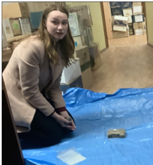
Рис. 3. Експериментальні дослідження в процесі проведення учбового курсу «Експериментальна археологія» в лабораторії кафедри археології та музеєзнавства Київського національного університету імені Тараса Шевченка

Матеріал шифрується і розкладається у пакети, які надалі надходять на експериментальний майданчик №3 (рис. 2, 4, 5).