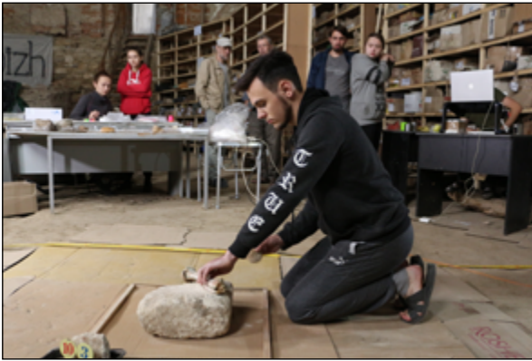
Рис. 5. Експериментальний майданчик в одному з приміщень Державного історико-культурного заповідника «Межибіж»

Fig. 5. Experimental site in one of the rooms of the State Historical and Cultural Reserve «Mezhybizh».