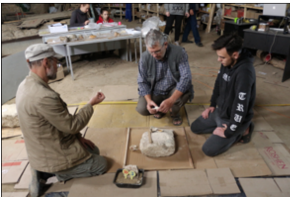
Рис. 7. Обговорення результатів експерименту

Fig. 6. The process of fixing and encryption of material at the experimental site