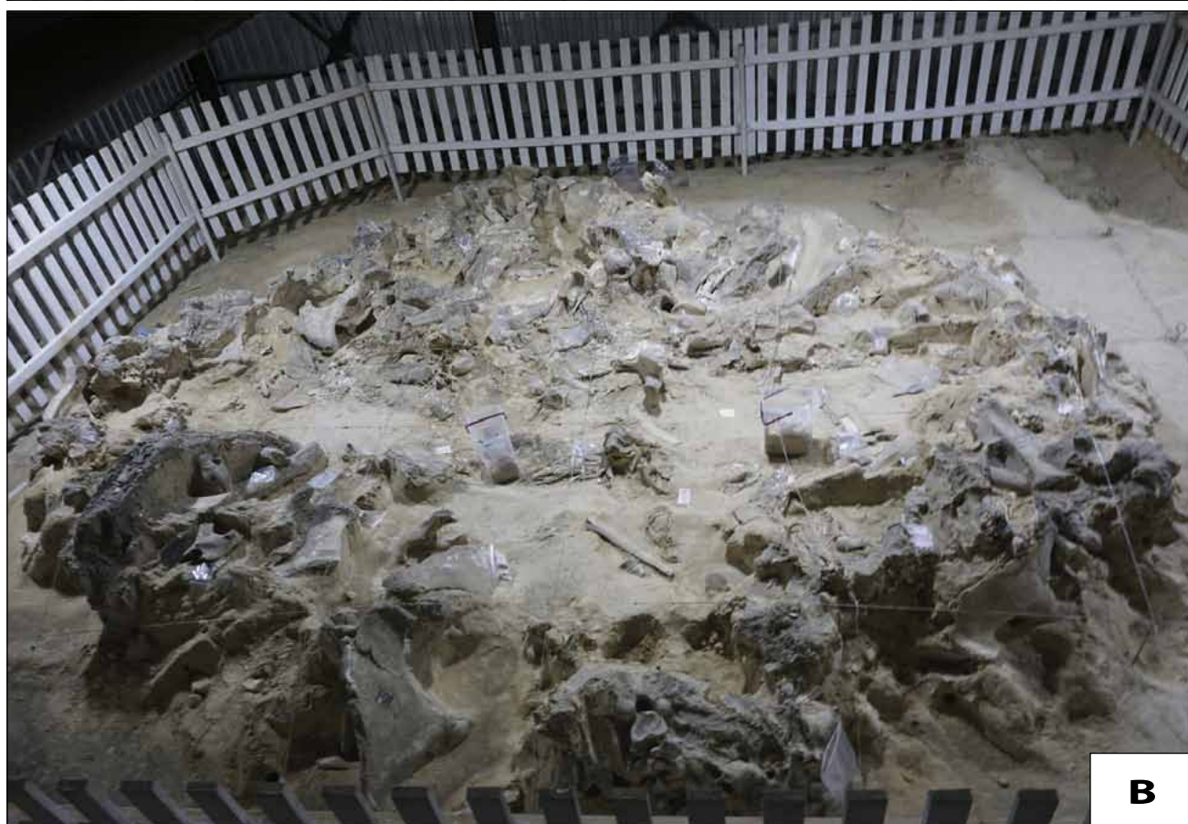
Рис 2. Сучасний стан решток четвертого житла Межиріцької стоянки: А – вигляд з південного сходу; В – вигляд з північного заходу.