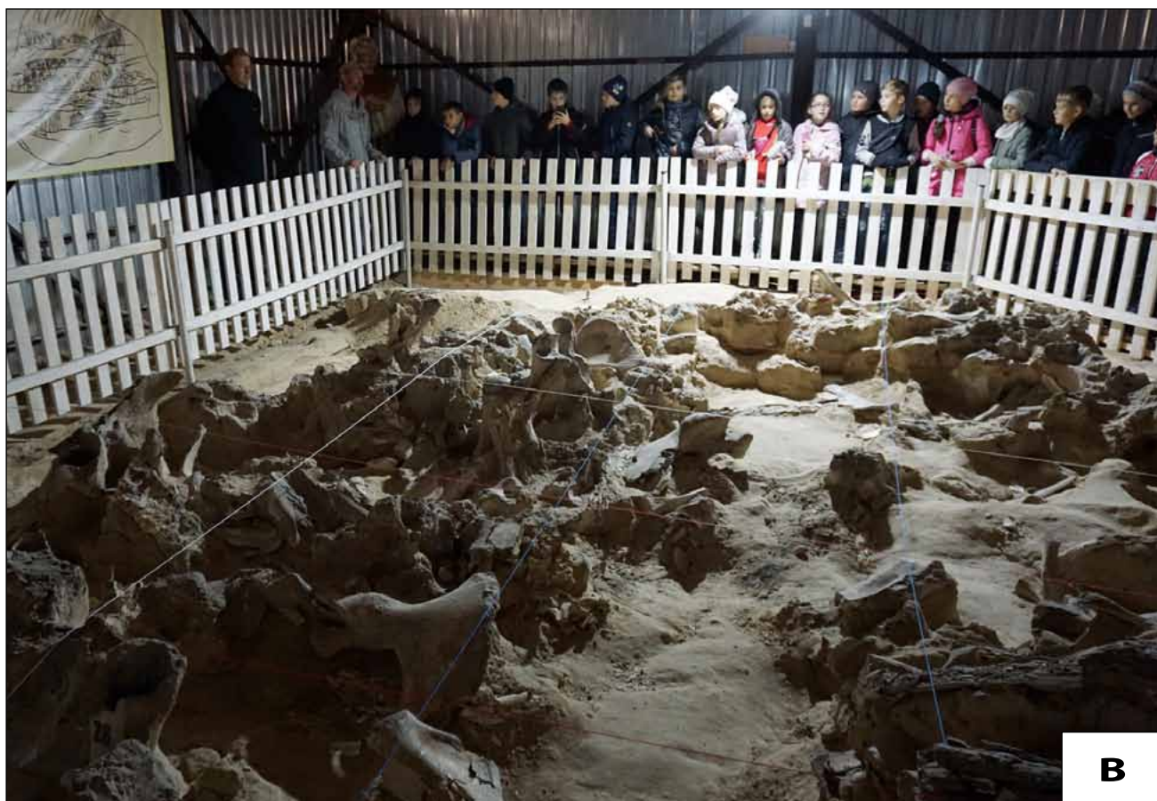
Рис 3. Дослідження та відвідування пам'ятки: А – металеве накриття над четвертим житлом; В – проведення екскурсії.