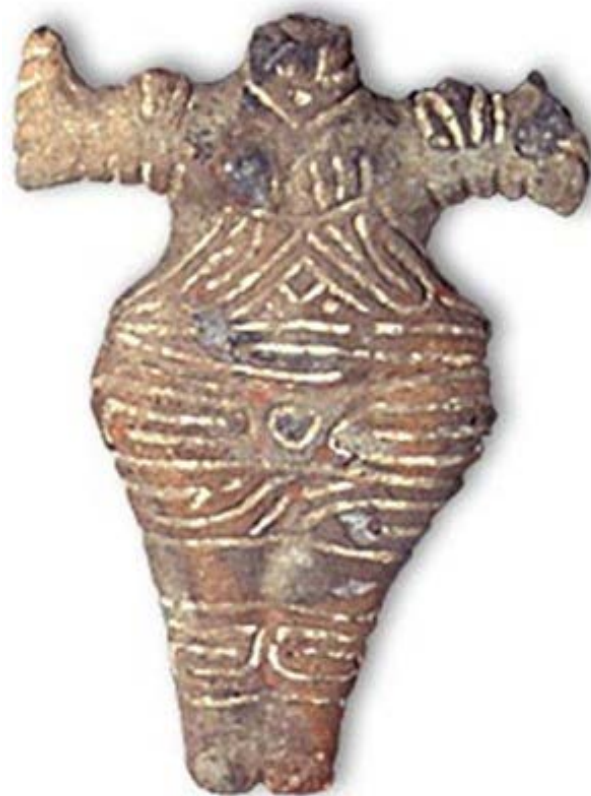
Рис. 2. Антропоморфна фігурка із Радовану.

Окрім чорно-сірої та білої кераміки, було знайдено кілька локалізованих прикладів оздоблення білою інкрустацією глиною. Починаючи з фази III, вони почали використовувати фарбу аграфіту для прикраси їхньої кераміки, метод, ймовірно, запозичений з культури Маріца південних Балкан.