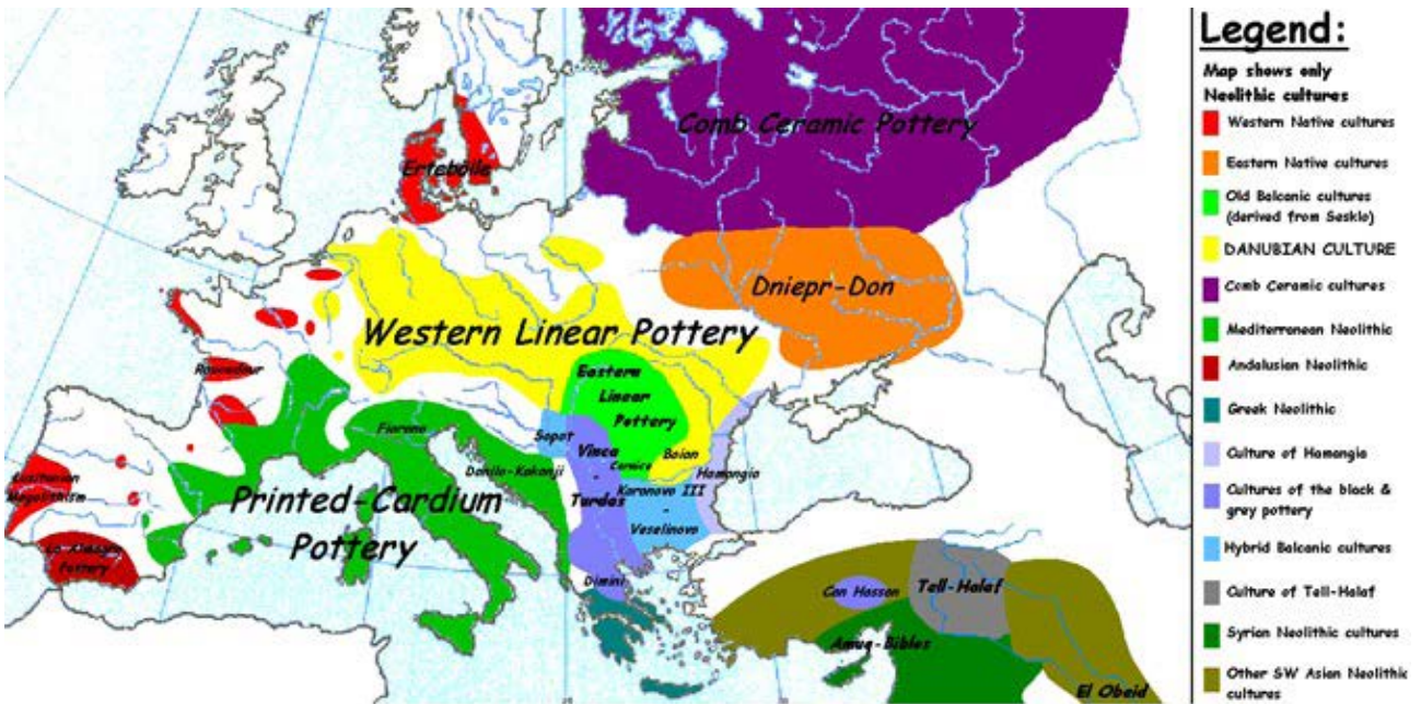
Рис. 4. Ареал поширення культури Боян (жовтий колір).