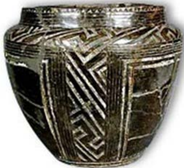
Рис. 1. Кераміка культури Боян.