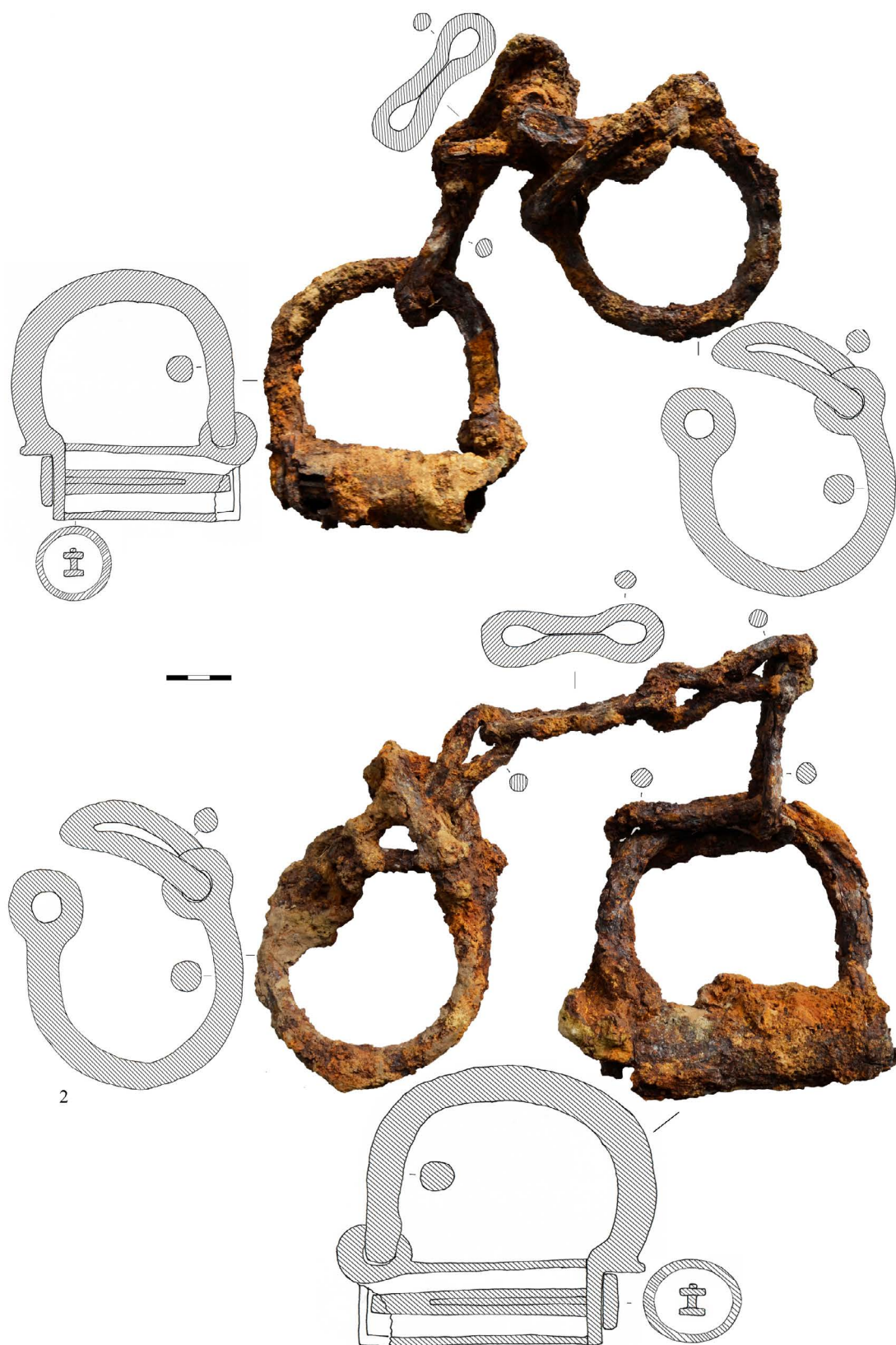
Рис. 2. Кінські пуга з дослідженої ділянки пам'ятки.