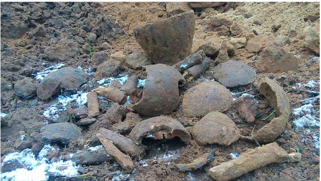
Рис. 3, 4. Зруйнований могильник епохи пізньої бронзи неподалік с. Лобачеве (Луганська область).