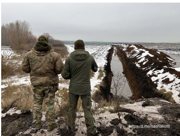
Рис. 6-10. Облаштування захисних споруд російськими окупантами (напрямок не відомий, але найімовірніше територія Луганської області).