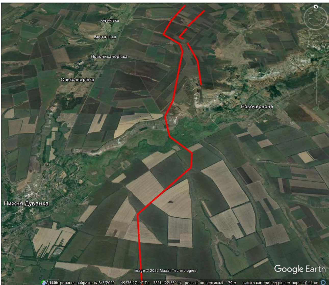
Рис. 5. Фрагмент ділянки із захисними спорудами російських окупаційних військ на території Сватівського району (приблизна реконструкція на підставі вивчення зображень від MAXAR).

вобережжю р. Красна у Сватівському районі Луганської області, з високою долею ймовірності пошкодять культурні шари давніх поселень або ґрунтових могильників, розташованих ближче до краю надзаплавної тераси або кургани на вододілах (рис.5). Також можна згадати й про ділянки заплави та надзаплавної тераси лівого берега р. Сіверський Донець, на яких щільність різночасових археологічних пам'яток настільки висока, що подекуди вони утво-