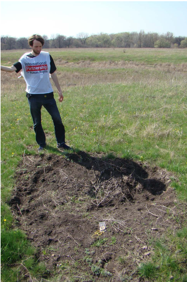
Рис. 2. Багатошарове поселення Занівське-І (на південь від смт. Борівське Луганської області) з вирвою від вибуху.