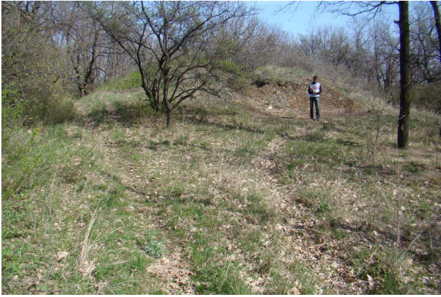
Рис. 1. Частково зруйнований насип кургану поблизу м. Тошківка (Луганська область).