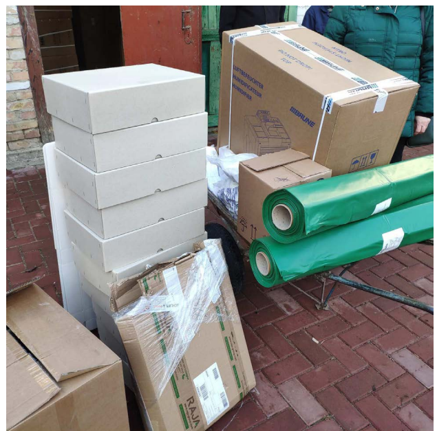
Рис. 11. Гуманітарна допомога для Астрономічного музею, листопад 2022 р.