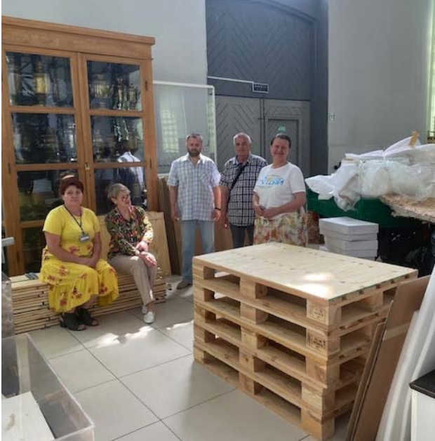
Рис. 9. Політехнічний музей отримав гуманітарну допомогу, червень 2022 р.

надали інформацію про найцінніші свої колекції для внесення до бази даних Держдепартаменту США з метою у сприянні у їх порятунку і захисті.