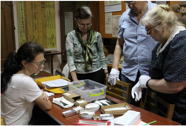
Рис. 2. Експонати доби бронзи повернулись до музею після реставрації.