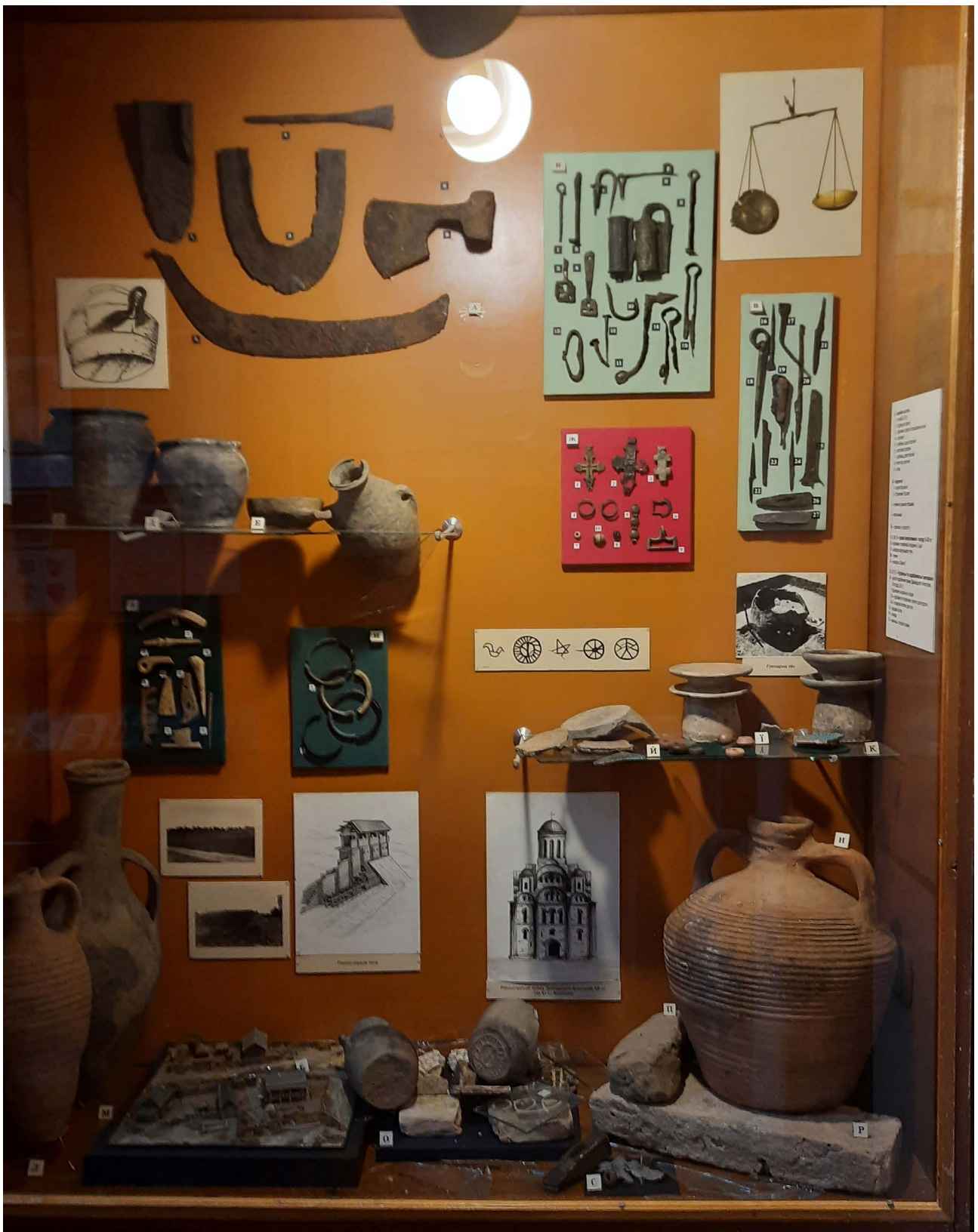
Рис. 6. Пошкодження експозиції часів Київської Русі після вибухів 10 жовтня 2022 р.