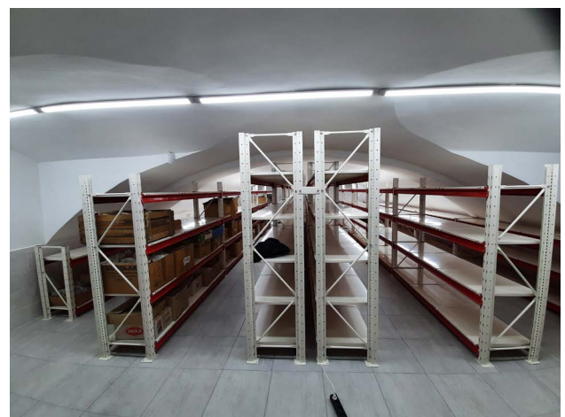
Рис. 1. Фондове приміщення Археологічного музею Київського національного університету імені Тараса Шевченка після капітального ремонту.

Як тільки стихли вибухи у Києві і на початку квітня з'явилась можливість добиратися до університету, співробітники музею продовжили свою роботу. Ще наприкінці 2021 р. університет на клопотання нашого музею уклав угоду з Київським «Центром консервації археологічних предметів» і розпочав заходи з реставрації бронзових знарядь праці і прикрас з експозиції. Стан експонатів давно вимагав невідкладного втручання фахівців. Частину експозиції