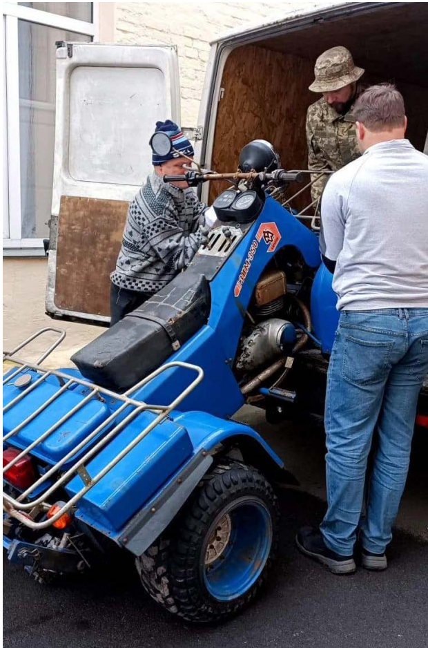
Рис. 7. Квадроцикл «ЗУМ-360» — новий експонат Державного політехнічного музею — надійшов 6 листопада 2022 р.