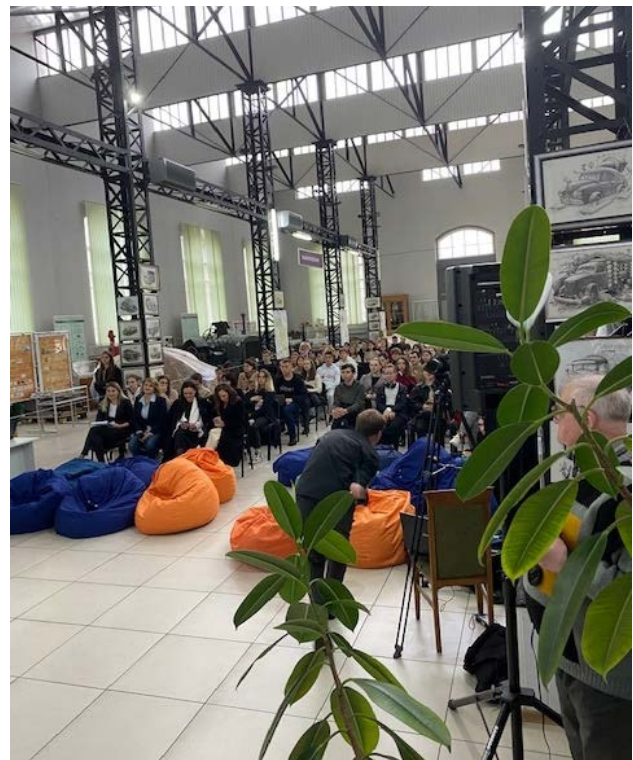
Рис. 8. 27 вересня 2022 р. в Політехнічному музеї відбувся захід для першокурсників «KPIFirstYearMarathon».

До Всесвітнього тижня космосу, що проходить під егідою ООН, в музеї планувалося проведення наукових читань, круглих столів за темою «Космос від ідеї — до практичного втілення». З урахуванням воєнного стану ми не змогли здійснити план в повній мірі, підготували і відкрили виставку з цікавими експонатами. Окрасою став магнітофонний ламповий приймач «Звук 1 М-64» який містить запис передстартової підготовки та першої роботи екіпажу «Союз-21» з ЦУПом на орбіті, датований 06. 07. 1976 року.