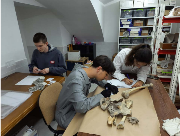
Рис. 5. Студенти на практиці у фондах Археологічного музею.