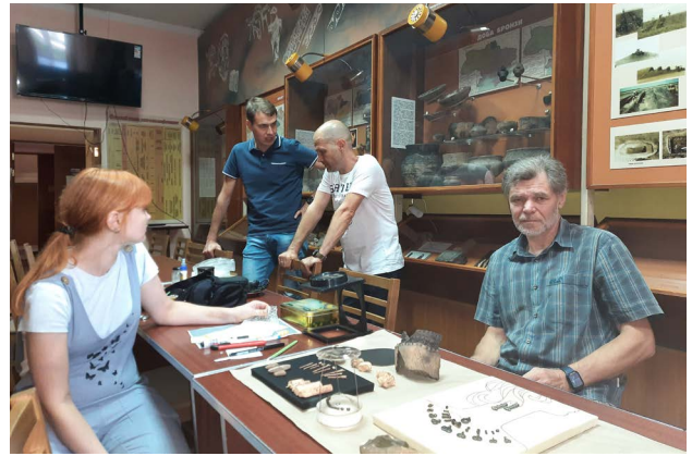
Рис. 3. Обговорення майбутньої експозиції з викладачами кафедри археології та музеєзнавства.