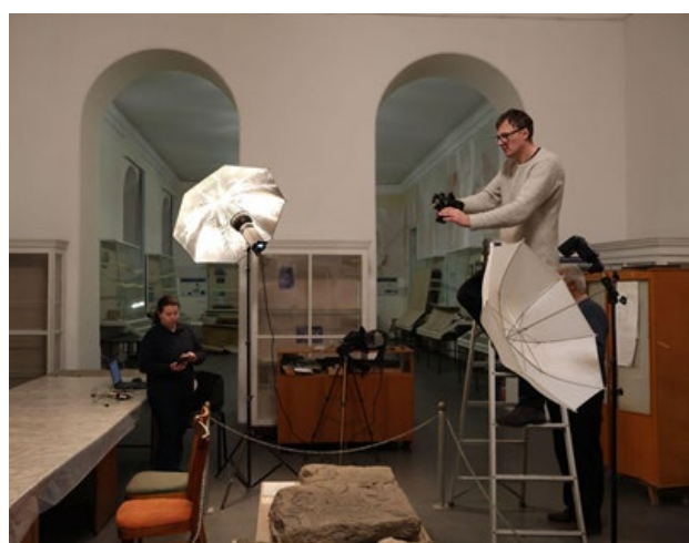
Рис. 10-11. Фотофіксація колекцій Одеського археологічного музею НАН України.