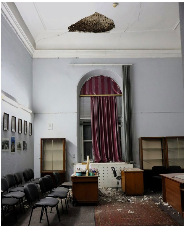
Рис. 8. Обвал стелі в Одеському археологічному музеї після масованих обстрілів.