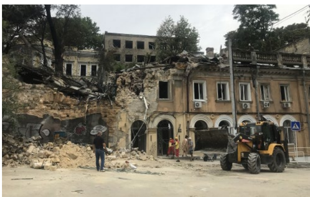
Рис. 7. Пошкодження історичних будівель Одеси під час масованих обстрілів.