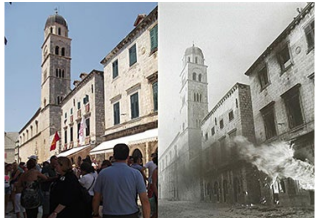
Рис. 2. Страдун 07.2013/12.1991 (Gaze 2014). Fig. 2. Stradun 07.2013/12.1991 (Gaze 2014).