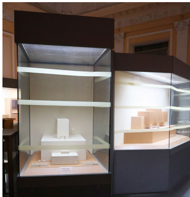
Рис. 4. Пусті вітрини в Одеському археологічному музеї після евакуації експозиції.

Багато об'єктів у центрі міста було забарикадовано. За допомогою громадських організацій, серед них Museum for Change, на культурних пам'ятках у центрі міста було прикріплено прапорці міжнародної організації Blue Shield (Невідкладна допомога закладам культури в Одесі. Фаза 1). Між тим, такий статус передбачає, що