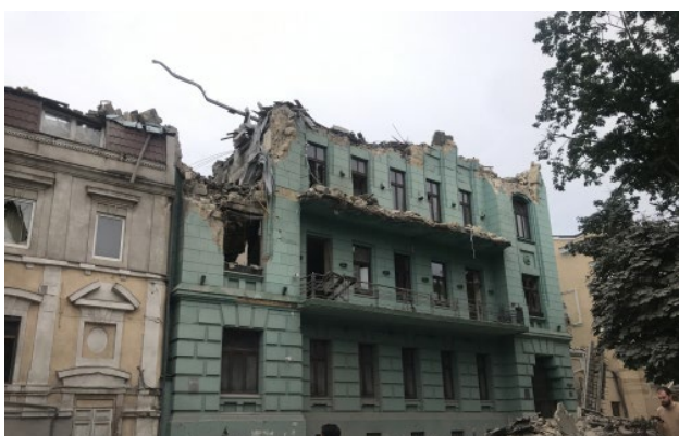
Рис. 6. Пошкодження історичних будівель Одеси під час масованих обстрілів.