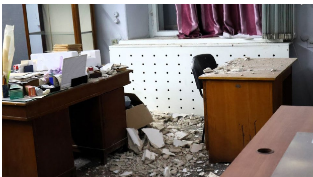
Рис. 9. Руйнування будівлі Одеського археологічного музею після масованих обстрілів.