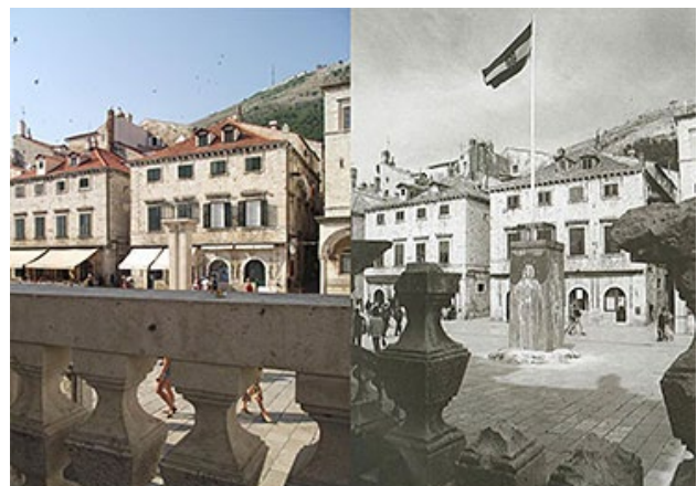
Рис. 3. Колона Орландо 07.2013/12.1991 (Gaze 2014). Fig. 3. Orlando Column 07.2013/12.1991 (Gaze 2014).