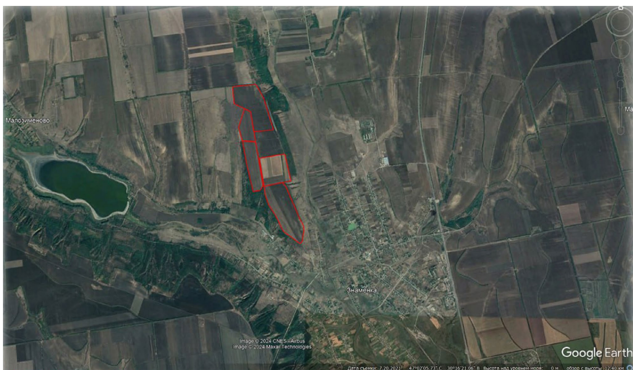
Рис. 2. Територія розташування стоянок кам'яного віку за державними актами.

І така ситуація прослідковується не тільки в Березівському районі і не тільки з пам'ятками кам'яної доби. Так, наприклад, в Одесі, під час взяття на облік поселення античного часу «Молдаванка», його місцерозташування було визначено помилково (Масюта, Піструїл 2021, с. 270). Внаслідок таких «помилко» територія археологічних об'єктів руйнується в ході господарчої та будівельної діяльності людини. Фахівці-археологи можуть нескінченно проводити роботи з уточнення місця розташування археологічних пам'яток та визначення їх охоронних зон (і це потрібно робити), але як кажуть «не важливо як голосують, важливо хто це підраховує». Під час взяття на облік не виключені помилки. Особливо, коли це робиться швидко, бо, наприклад, потрібно «освоїти» кошти до кінця року. А документацію з помилками, що була затверджена багатьма інстанціями, вже ніхто виправляти не буде.